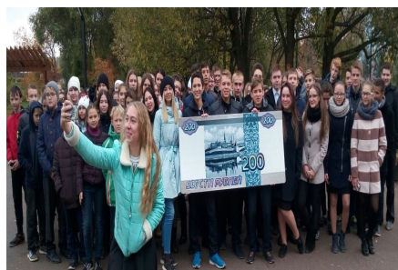
Лотерея «Подарок за голос!»